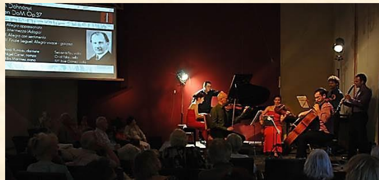
Großartig auf Son Bauló

Das Image Ensemble ist eine Gruppe aus den herausragendsten Solisten des Symphonieorchesters der Balearen und Dozenten des Konservatoriums in Palma. Das erste Konzert am 15.06.2014 war von ungeahnter Schönheit und allerhöchstem Anspruch.