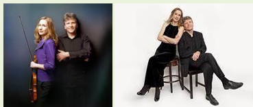
The Chronicle Herald, Halifax

“Two packages of musical dynamite that would credit any stage in any city in any continent on the planet!...They [play] with the kind of virtuosity that doesn't draw attention to itself but makes you hold your breath anyway.”