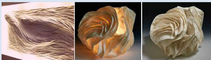
Wandobjekt im öffentlichen Raum ca 220 x 580 cm / Tisch-Skulptur mit und ohne Illumination

Mit einer Performance von Andreas Max Martin Andreas singt Jazz Pop Songs mit surrealen Texten.