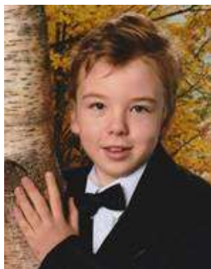
Georg Willme Preisträger: Piano, Violine

Son Bauló und Will, Ist der kulturelle Overkill.